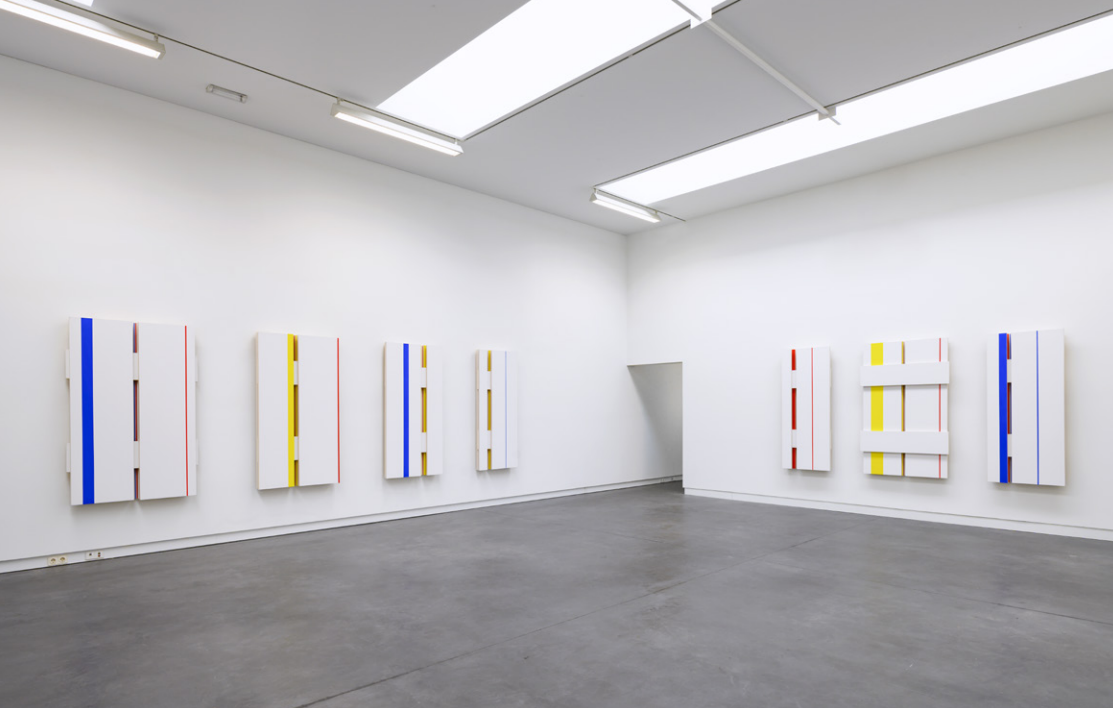
Detail of '2-2019 / celebration of light ' 2019 acrylic on canvas 14 parts with layered segments, project space De Pont Museum, 2019